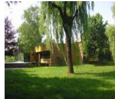
Centar Dugave Sjedište: Ul. sv. Mateja 70a