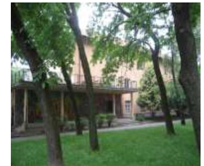
Podružnica smještaja i organiziranog stanovanja sjedište Podružnice: Župančičeva 14

Centar Dugave javna je ustanova socijalne skrbi koja pruža usluge socijalne skrbi izvan vlastite obitelji za zadovoljavanje socijalno zaštitnih potreba djece i mladeži, koja iskazuju poremećaje u ponašanju, u dobi od 7. do 21. godine života, odnosno najduže do 26. godine (u organiziranom stanovanju uz povremenu podršku).